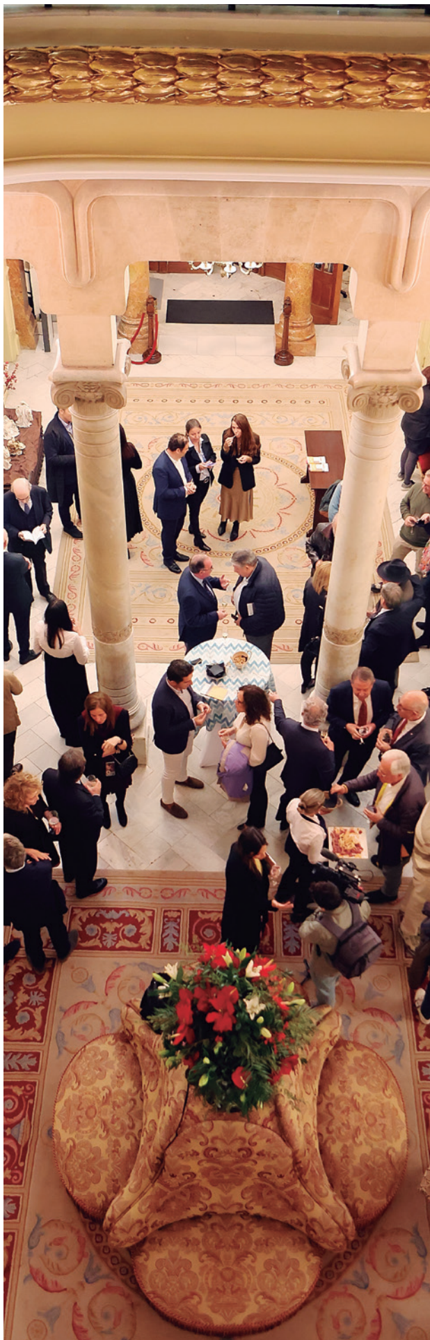
Vestíbulo del Parlament