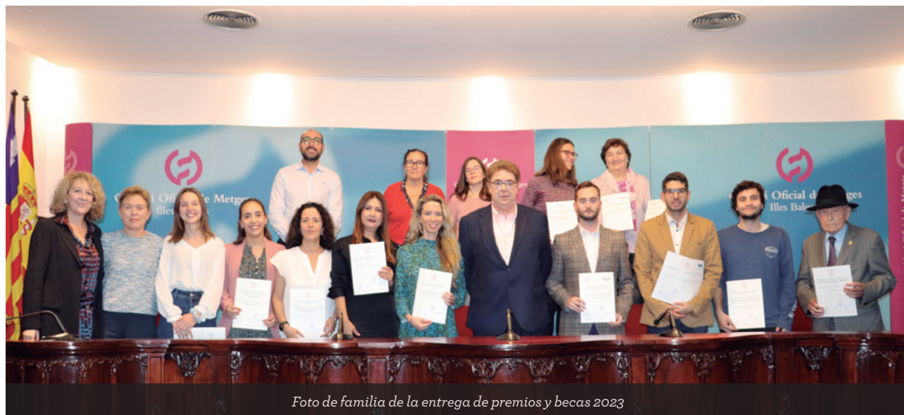
Foto de familia de la entrega de premios y becas 2023

La Fundació Patronat Científic del Col·legi Oficial de Metges de les Illes Balears (Comib), hizo entrega de sus tradicionales premios y becas en un acto que tuvo lugar en el salón de actos del Comib.