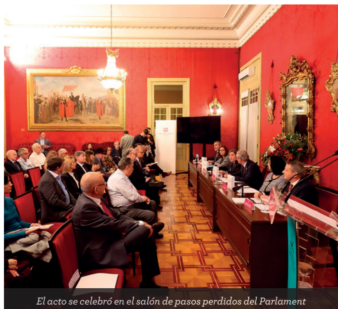
El acto se celebró en el salón de pasos perdidos del Parlament